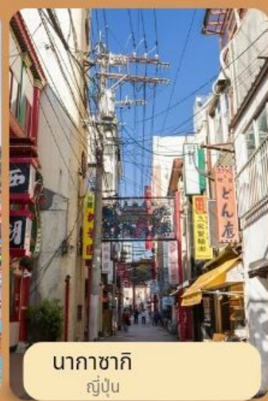
นากาซากิ ญี่ปุ่น