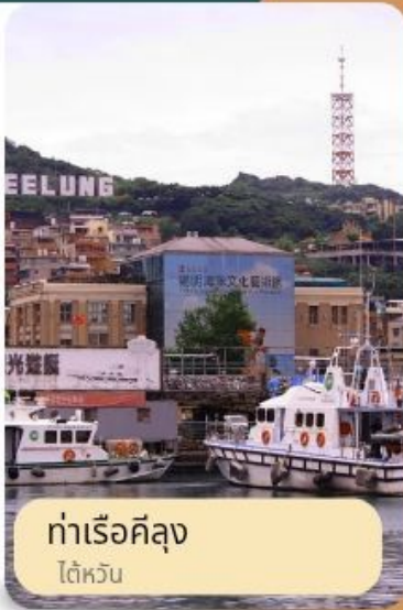
ท่าเรือคิง ไต้หวัน