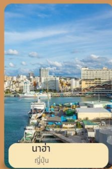
นาฮา ญี่ปุ่น