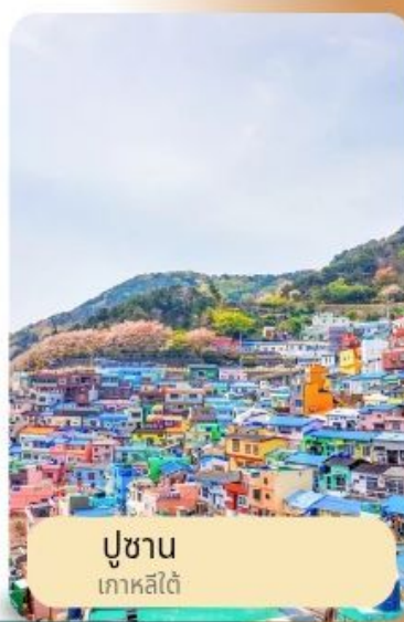
ปูซาน เกาหลีใต้