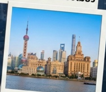
เข็คอินที่เดอะบันด์

Special Option : ตั๋ว Disneyland + รถรับ-ส่ง เริ่มต้นที่ 3,900 บาท/ท่าน