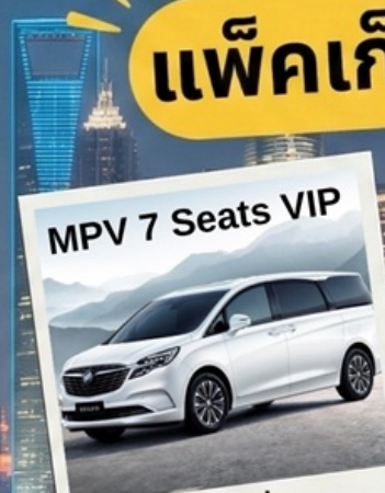
MPV 7 Seats VIP