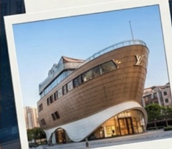
เข็คอินเรือหลุยส์วิทอง

Special Option : ตั๋ว Disneyland + รถรับ-ส่ง เริ่มต้นที่ 3,900 บาท/ท่าน