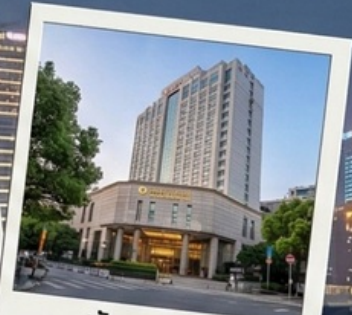
พักรู 4 ดาว City Hotel shanghai 3 คืน