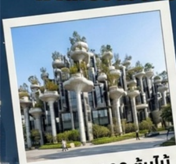
อาคาร 1000 ต้นไม้