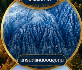
แกรนด์แคนยอนชยุถุน