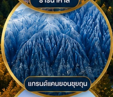
แกรนด์แคนยอนซูยกุน