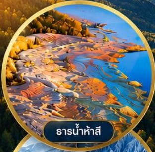
ธารน้ำห่าสี