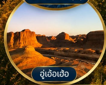
อู่เอ้อเอ้อ