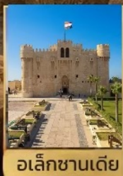
อเล็กซานเดีย