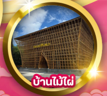
บ้านไม้ไฟ