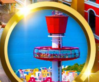
นั่งเครื่องยก Eagle Eye