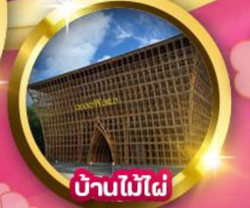
บ้านไม้ไฟ

นั่งกระเช้าลอยฟ้าที่ยาวที่สุดในโลกข้ามทะเลสีครามสู่ เกาะ Hon Thom Eagle Eye หอคอยชมวิวแบบ 360 องศา เห็นเกาะฟู้ทัก VinWonder สนุกสุดเหวี่ยงกับเครื่องเล่นระดับสากล อควาเรียมทรงเต่ายักษ์ สุดตระการตา "เวนิสแห่งเอเชีย" Grand World Phu Quoc สถาปัตยกรรมสไตล์ยุโรปหลากสีสัน