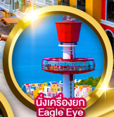
นั่งเครื่องยก Eagle Eye