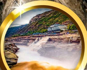
น้ำตกหูโข่ว