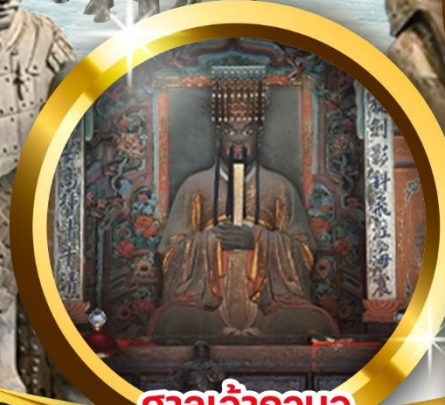
ศาลเจ้ากวนอู