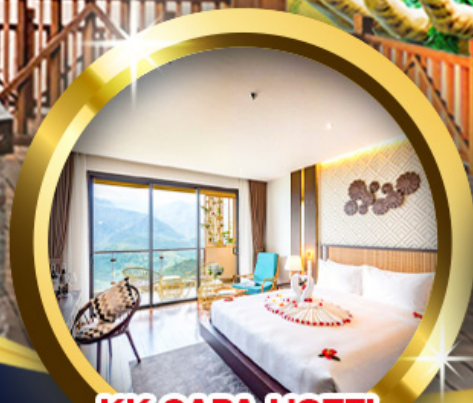
KK SAPA HOTEL วิวภูเขา 180 องศา