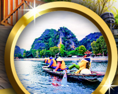
นั่งเรือดิงห์บิงห์