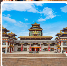
ทำเนียบพระลามะอูหลาน