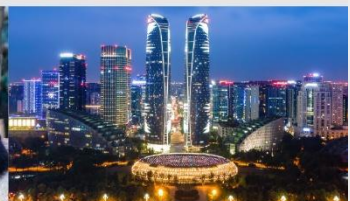
ตึกแฝดเจียงตู

*ทางบริษัทฯ ขอสงวนสิทธิ์ในการสลับโปรแกรมทัวร์ตามความเหมาะสมขึ้นอยู่กับสถานการณ์หน้างาน โดยคำนึงถึงผลประโยชน์ของลูกค้าเป็นสำคัญ