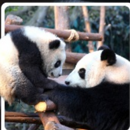
หุบเขาแพนด้าดูเจียงเอี้ยน