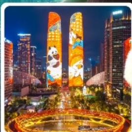
ตึกแฝดเจิงตุ