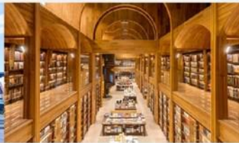
ห้องสมุด Fang Suo