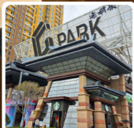
ห้าง G Park