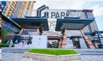
ห้าง G Park