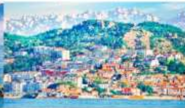
หมู่บ้านชาวประมงซาจื่อโซ่ว