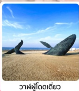
วาฬผู้โดดเดี่ยว