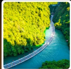
คุบเขาสิงโต

โวลีกั! บินตรงลงเอนซือ เกียวเอนซือเน้นๆจัดเต็มทั่วเมือง คุบเขาสิงโต ผิงชานแกรนด์แคนยอน อุกยานจันลี่ชาน