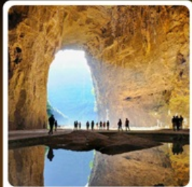
ถ้ำถึงหลาง