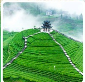
ไร่ชาอู่เจียโต