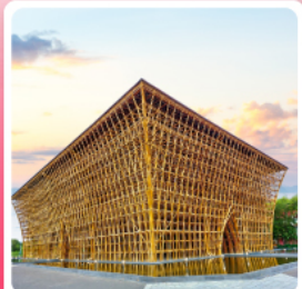
บ้านไม้ไฟ