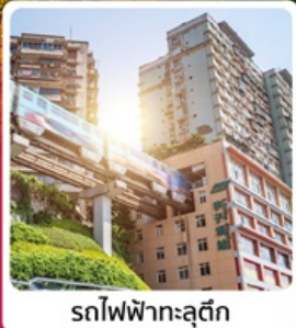
รถไฟฟ้าทะเลติก