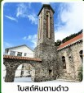
โบสถ์หินตามด้าว