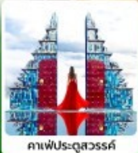
คาเฟ่ประตูสวรรค์

• ไฮไลท์ พิธีขอตบเข่าผ่านฮิปปี้ ชมวิวเมืองซาปาแบบ 360 องศา สัมผัสกลิ่นอายยุโรปที่ปราสาทตามด้าว เขื่อนหินกำแพงสูงแก่ประตูสวรรค์