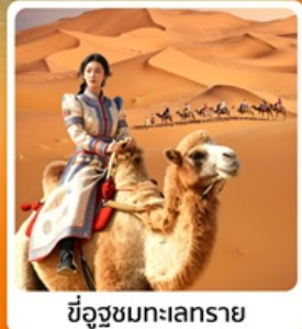
ชีอูซูชมทะเลทราย