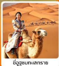
ขี่อูซูชมทะเลทราย