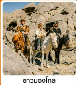
ชาวมองโกล