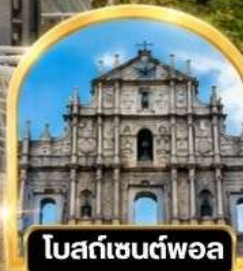
โบสถ์เซนต์ฟอล