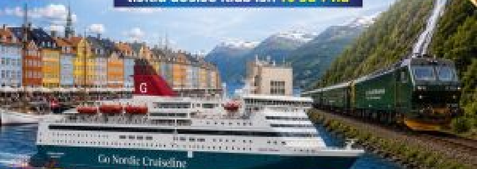
Go Nordic Cruise Line

SPECIAL OFFER ... มอนสเตอร์ 1 คืน ล่องเรือบนเรือสำราญ Flamsbana