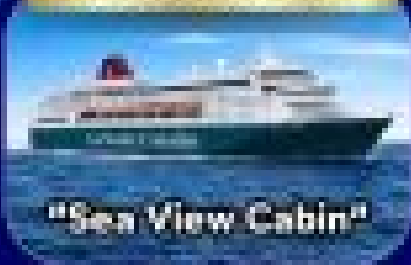
"Sea View Cabin"