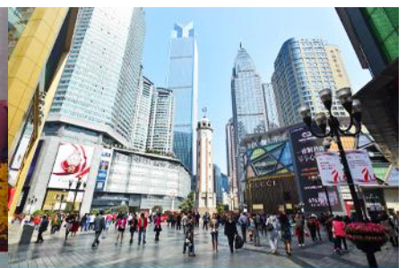
ย่านเว็ยฟางเปย