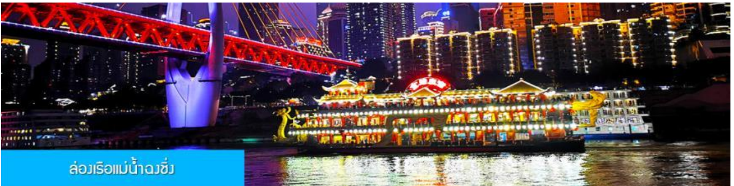
ล่องเรือแม่น้ำฉงชิ่ง