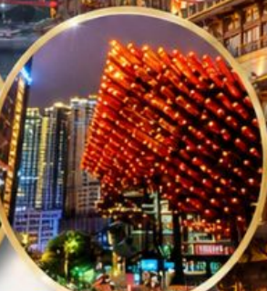
หอศิลป์กั๋วไท่ Guotai Arts Center