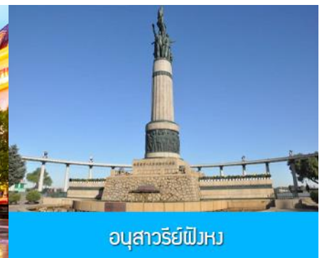
อนุสาวรีย์ผึ้ง