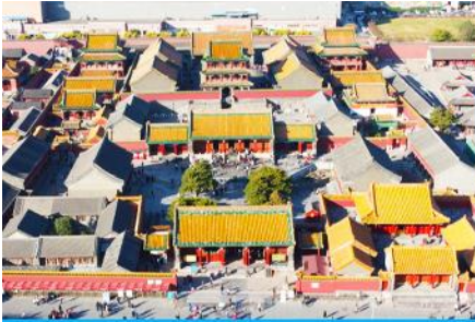
พระราชวังโบราณเสิ่นหยาง

รับประทานอาหารเช้า ห้องอาหารของโรงแรม (4)