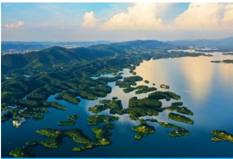
เมืองซีอี่