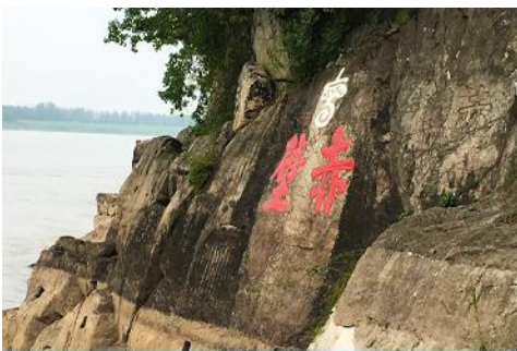
สมรภูมิมิผาแดง

พักที่ CHIBI HOTEL โรงแรมระดับ ดาวท้องถิ่นในเมืองซีอี่