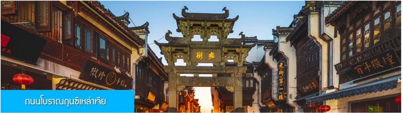
ถนนโบราณถนนซีเหล้าเจีย

นำท่านเที่ยวชม ถนนโบราณถนนซีเหล้าเจีย 屯溪老街 ถนนที่เป็นย่านการค้าโบราณในยุคราชวงศ์ซ่งอายุกว่าพันปี ถนนมีความยาวราว 980 เมตร สองฝั่งถนนมีอาคารบ้านเรือน โบราณสไตล์หูยโจว ยุคปลายราชวงศ์หมิง และราวส์ซิงที่ถูกอนุรักษ์ไว้เป็นอย่างดี ปัจจุบันยังมีห้างร้าน โบราณ อาทิ ร้านขายโบราณวัตถุ ร้านขายหยก ร้านขายภาพเขียนและอักษรพู่กัน โบราณ ร้านอาหารพื้นเมือง ร้านขายของที่ระลึก ฯลฯ นอกจากนี้ร้านค้าและอาคารบ้านเรือน โบราณที่นี่ยังเป็นแหล่งรวมของนักท่องเที่ยวที่มาชิมอาหารพื้นเมือง เดินช้อปปิ้ง และถ่ายภาพเช็คอิน