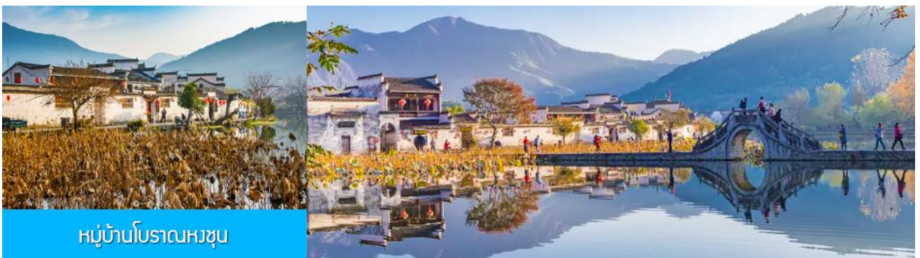
หมู่บ้านโบราณหงซุน

พักที่ โรงแรม QISHUHU HOTEL OR ZHONGCHENG SHANZHUANG 4* หรือเทียบเท่าในเขตอุทยานหวงซาน