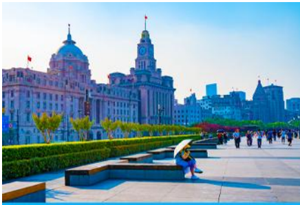
หาดว่อกาน