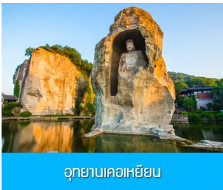
อุทยานเคอเหยียน

พักที่ โรงแรม KAIYUAN MINGTING HOTEL 4* หรือเทียบเท่าในเมืองเส้าชิง