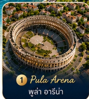
1 Pula Arena พูลา อาร์น่า