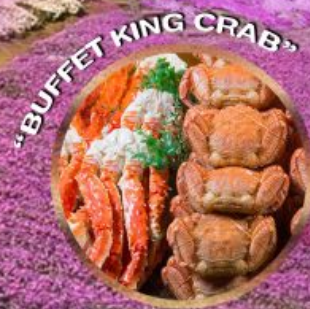
"BUFFET KING CRAB"