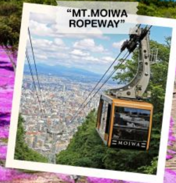
"MT. MOIWA ROPEWAY"

OBIHIRO / FURANO / BIEI / SOUNKYO / KITAMI / MOMBETSU / TAKINOUE / KAMIKAWA / SAPPORO / OTARU / PINKMOSS