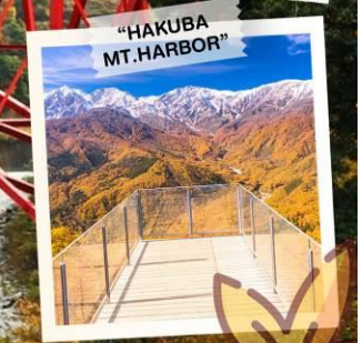
"HAKUBA MT. HARBOR"

วันเดินทาง 28 ต.ค. - 3 พ.ย. 2569 4 - 10 , 11 - 17 พ.ย. 2569