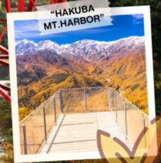
"HAKUBA MT. HARBOR"

วันเดินทาง 28 ต.ค. - 3 พ.ย. 2569 4 - 10, 11 - 17 พ.ย. 2569