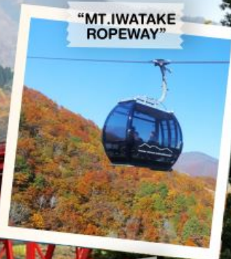
"MT. IWATAKE ROPEWAY"