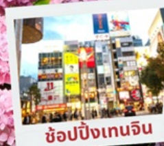
ช้อปปิ้งเทนจิน