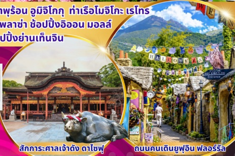
สักการะศาลเจ้าดัง ดาไซฟู