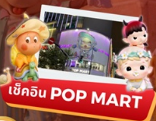
เช็คอิน POP MART