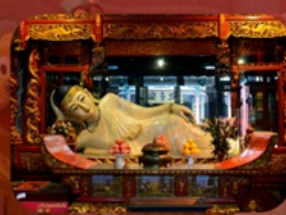
สักการะวัดพระหยกขาว