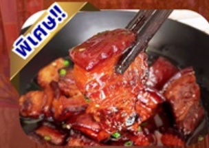
เมนูหมูสามชั้นตุ๋นน้ำแดง