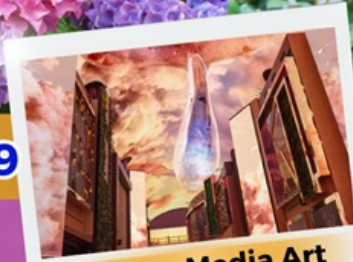
Aurora Media Art