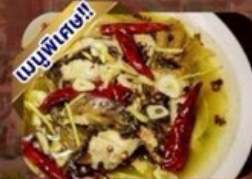
ปลาต้มพริกทอด