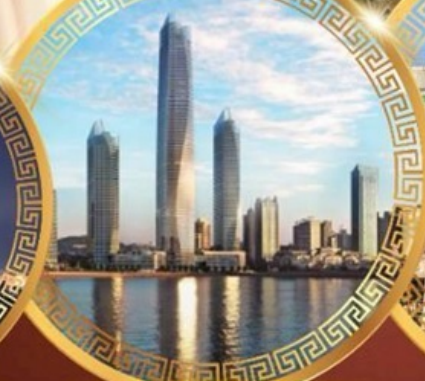
ชมวิวดาคารไฮตัน เซ็นเตอร์