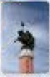
ชมอนุสาวรีย์ อูฐ (เช้า)