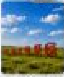
ทุ่งหญ้าเขียว และทะเลทรายอันกว้างไกล ในออร์ดอส (เช้า)