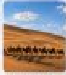
ชมคาราวานอูฐ ในทะเลทราย (เช้า)