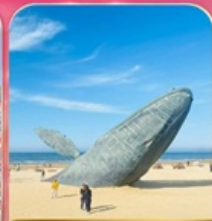
ประติมากรรม "วาฬผู้โดดเดี่ยว"