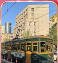
ขั้วรถรางไฟฟ้าชมเมือง