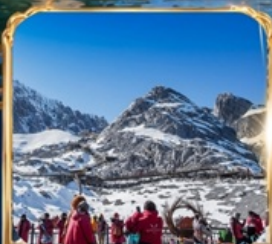
ภูเขาหิมะมังกรหยก +กระเช้าใหญ่