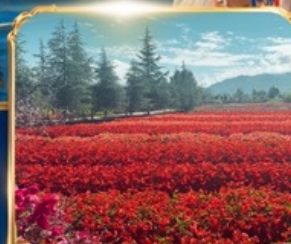
สวนดอกไม้ HUA YU MU CHANG