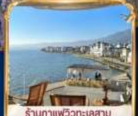
ร้านกาแฟวิวทะเลสาบ BAN SHAN YUE (รวมค่าเช่า ไม่รวมเครื่องดื่ม และค่าเช่าเตียงกำขม)