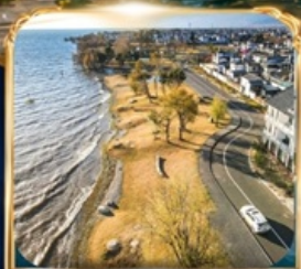
ทะเลสาบเอ่อไห่ โค้งตัว S