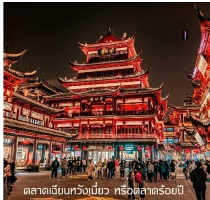
ตลาดเจียนหวังเมี่ยว หรือตลาดร้อยปี