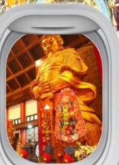
วัดฯชางหมิว