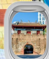
เมืองโบราณหนาวโกว