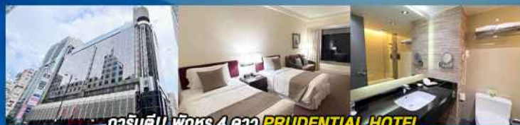
гаринดี!! พักหรู 4 ดาว PRUDENTIAL HOTEL ติดถนนนาธาน ย่านช้อปปิ้งจิมซาจуй