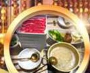
บุฟเฟ่ต์ชาบู เบอรี่ไม้อัน!!