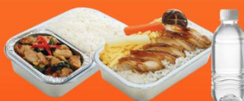
บริการอาหารร้อนบนเครื่อง ขาไป - ขากลับ