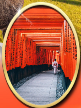
Fushimi Inari Shrine

รหัสทัวร์ RJ-XJ139 เดินทาง 5D 3N ท.ย. - ต.ค. 2569