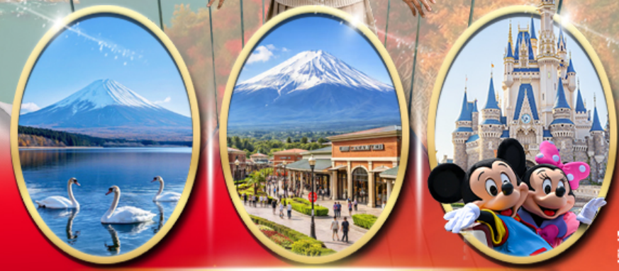
Lake Yamanakako Gotemba Premium Outlets อิสระเลือกซื้อบัตร Tokyo Disneyland

รหัสทัวร์ RJ-XJ134 เส้นทาง 5D 3N ท.ย. - ต.ค. 2569