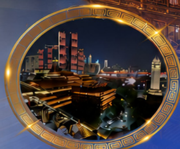
มือค้ำร้านอาหารวิวหลักล้าน ชมแสงสีเมืองลงซิ่ง