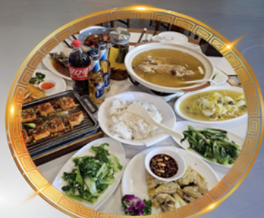
โต๊ะจีนลองซิ่ง เมนูต้นตำรับ รสจัดจ้านแท้ๆ