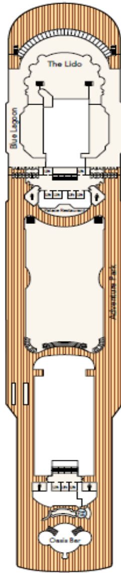
DECK 14 Hot tub, Adventure Park, Restaurants & Bar