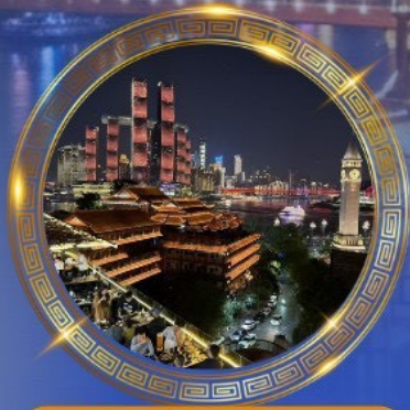
มือค้ำร้านอาหารวิวหลักล้าน