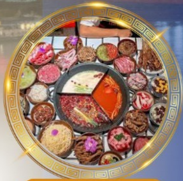
บุฟเฟต์หม้อไฟลองซิ่ง