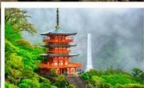
ศาลเจ้าคุมาโนะนาจิ