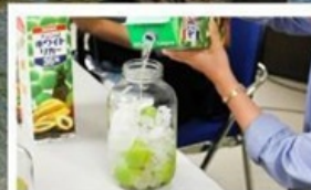
เวิร์กช็อปทำ Umeshu