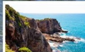
ท้ำซันดินเบกิ