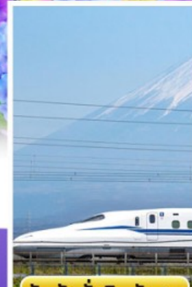
สัมพัสนั่งชินคันเซน