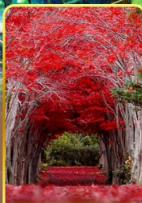
สวนอิราโอกะ