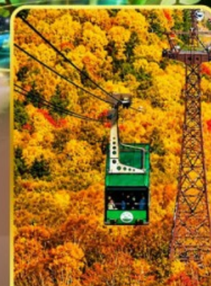
กระเช้าคุโรดากะ