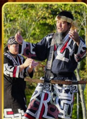
พิพิธภัณฑ์โอนู