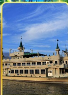
ล่องเรือทะเลสาบโทยะ