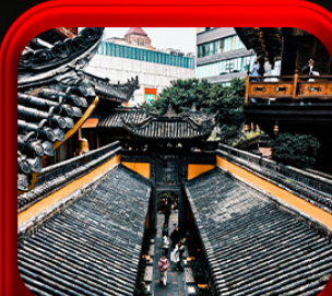
“ วัดหลิวฮั่น ”