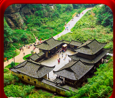
“ อุทยานหลุมฟ้าสะพานสวรรค์ ”