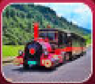
"อุทยานเทานางฟ้า"