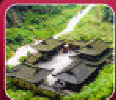
"อุทยานเทานางฟ้า"