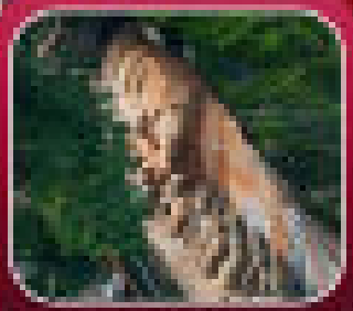
"อุทยานน้ำร้อน"