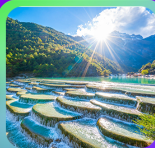
"ทะเลสาบโป๋ส่วยเหอ"