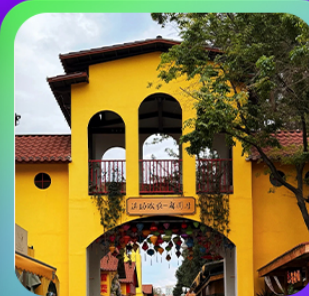
"หม่าหยวนมิเตอร์กจ"