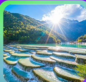
“ทะเลสาบโป้ซู่เหอ”