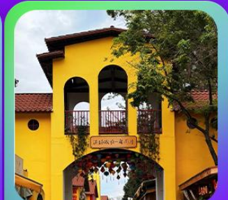
“หมาหยวนมิเตอร์เกจ”