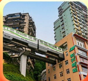
“นั่งรถไฟทะลุติ๊ก”