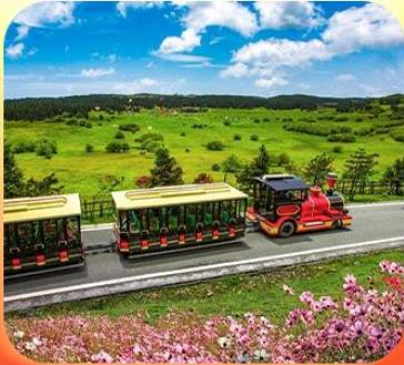
“อุทยานเขานางฟ้า”

บินตรงลงชิง • อุ่หลง หลุมฟ้าสะพานสวรรค์ • ระเบิดยงแกว • อุทยานเขานางฟ้า หงหยาดัง • นิ่งรถไฟทะลุตึก • ล่องเรือชมฉางชิ่งยามค่ำคืน • ศาลาประชาม (ด้านนอก) มรดกโลกผาหินแกะสลักต้าจู้ • เมืองโบราณสี่ปาตี้ • วัดหลิวฮั่น • ตึกตะเกียบ