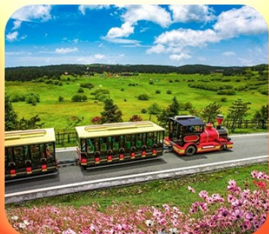
“อุทยานเขานางฟ้า”

บินตรงลงชิง • อุ่หลง หลุมฟ้าสะพานสวรรค์ • ระเบียบแก้ว • อุทยานเขานางฟ้า หงหยาดัง • นั่งรถไฟทะลุติ๊ก • ล่องเรือชมฉางชิ่งยามค่ำคืน • ศาลาประชาคม (ด้านนอก) มรดกโลกผาหินแกะสลักต้าจู้ • เมืองโบราณสี่ปาตี • วัดหลิวฮั่น • ตึกตะเกียบ