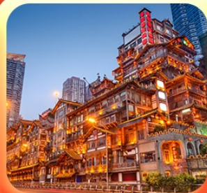
“ล่องเรือชมฉางชิ่งหงหยาดัง”