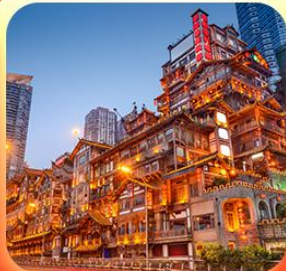
“ล่องเรือชมวิวหงหยาดัง”