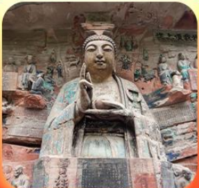
“ผาหินแกะสลักต้าจู้”