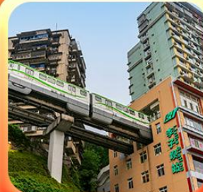
“นึ่งรถไฟทะลุตึก”